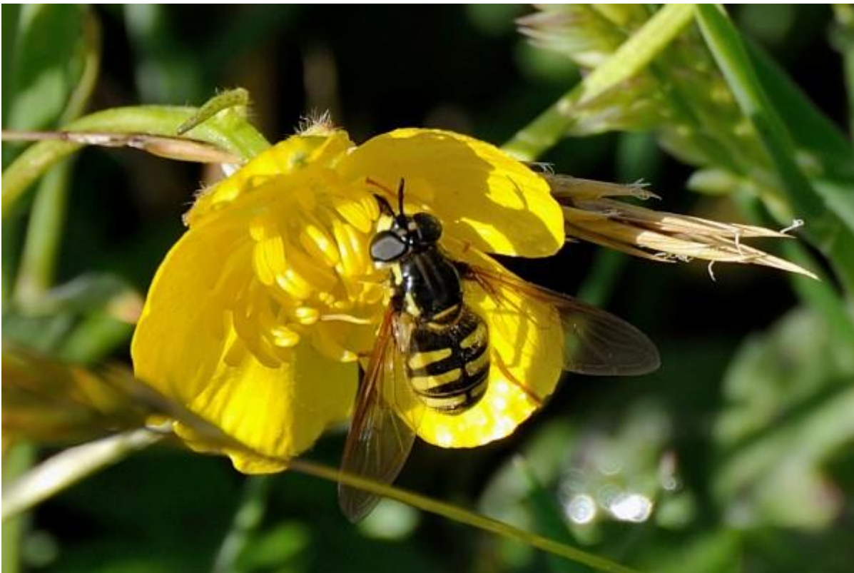
Grote fopwesp op boterbloem