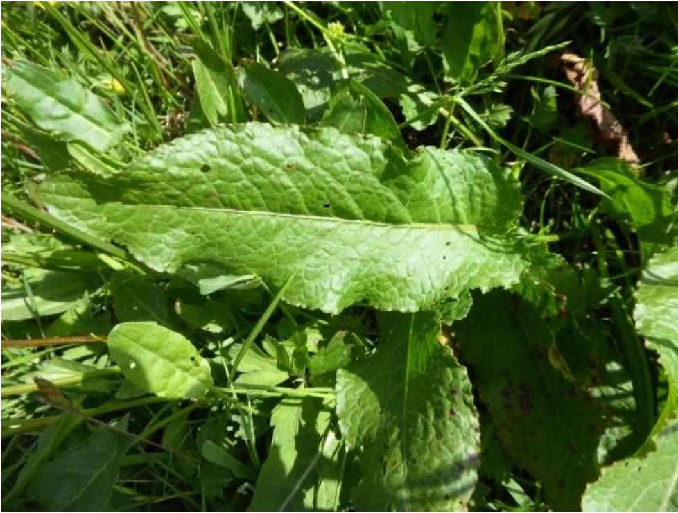
Bermzuring een kruising tussen krulzuring (hieronder) en ridderzuring